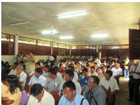
Más de un centenar de apus fueron informados sobre el Eje Vial N.º 4