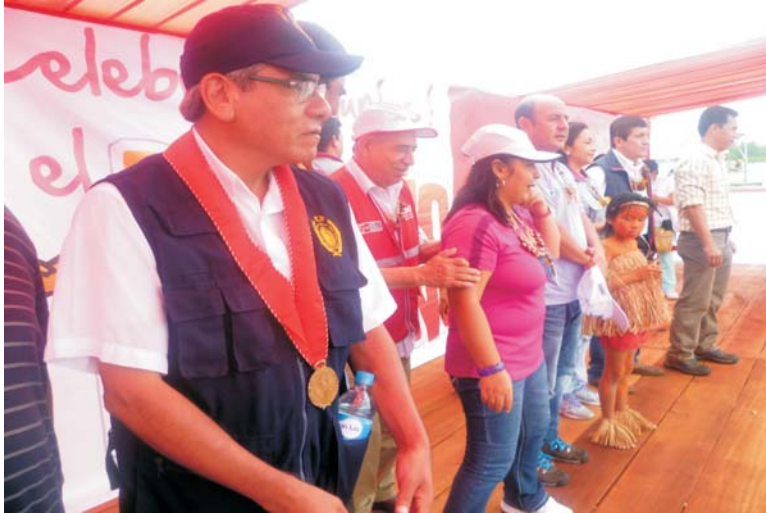
Las autoridades homenajean a los huambrillos