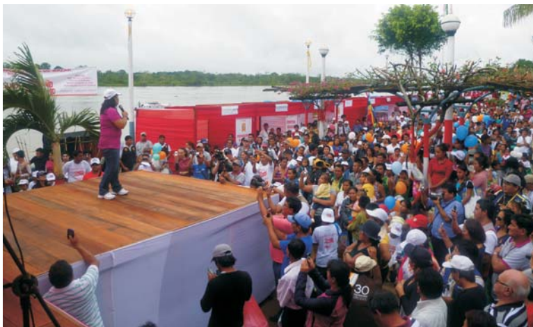
La señora Ministra de la Mujer, Dra. Ana Jara, se dirige a los niños y adultos de Mazán