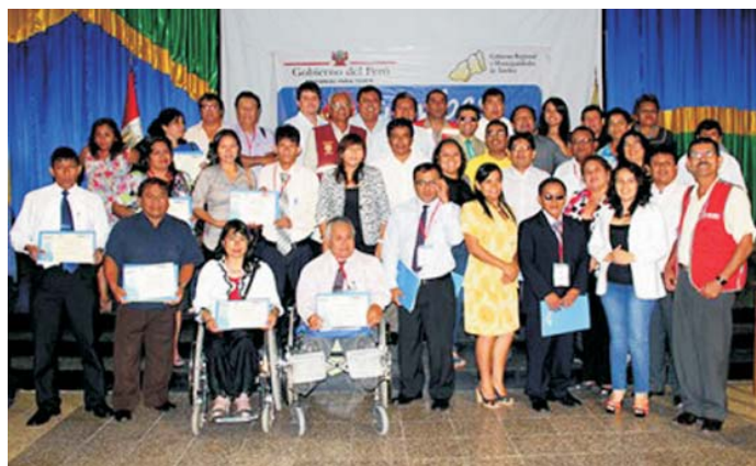
Participantes de la pasantía para gestores en el marco de “Tumbes Accesible”

El Plan Binacional participó en un taller de capacitación para la formulación de proyectos realizado por CONADIS en Tumbes, a los participantes en la pasantía “Formación de Gestores en Desarrollo bajo el Enfoque de Discapacidad”, en el marco del programa “Tumbes Accesible”, el 11 de abril. El taller contó con participantes a nivel nacional y permitió afinar las posibilidades de trabajo conjunto a partir de la formulación de proyectos que sean viables y sostenibles.