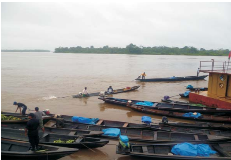
Mazán se encuentra en la cuenca del Napo, única vía de comunicación

El Plan Binacional viene impulsando para la cuenca del Napo un proyecto de potenciamiento de las redes para el funcionamiento de Tele Estado (telemedicina, tele-educación, RENIEC, etc.), dentro del esquema de trabajo integral del Estado en el marco del Plan Nacional para la Adolescencia y Infancia (PNAIA) que lidera el Ministerio de la Mujer.