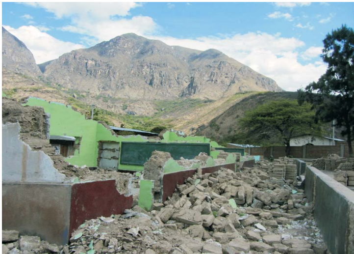
Así estaba.- Instalaciones colapsadas de la escuela.

Las nuevas instalaciones permitirán estudiar a 70 alumnos de primaria y comprenden dos nuevas aulas, dos áreas de servicios higiénicos, local de dirección y sus respectivas veredas; con un costo total de S/. 289,587.87, de los cuales el Fondo Binacional aportó S/. el equivalente a S/. 154,800