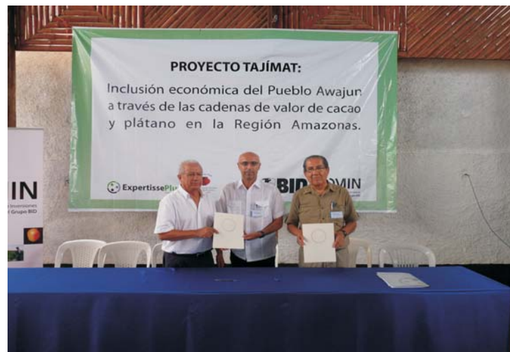
Convenio suscrito: BID - Expertisse Plus.