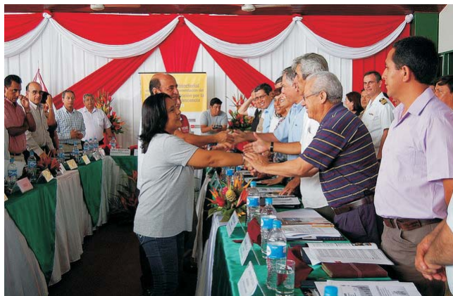
Unidos por la niñez y la adolescencia y por una mayor presencia del Estado y sus servicios en el Napo