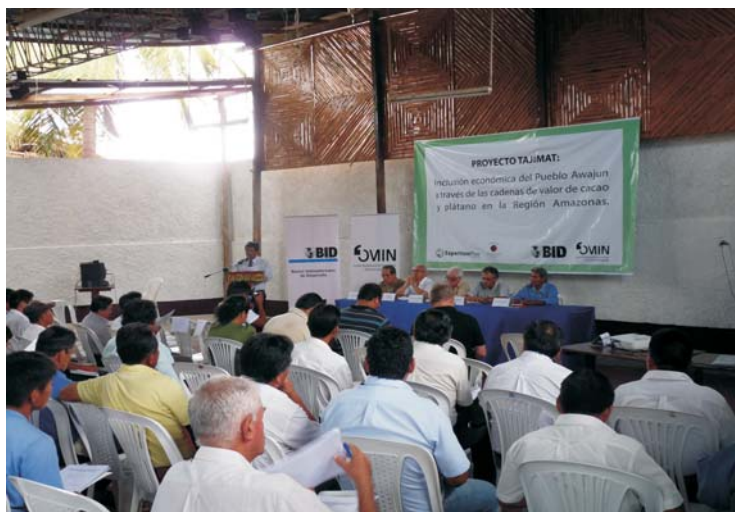
Proyecto Tajimat involucra a toda la comunidad, autoridades, ejecutores, BID y Plan Binacional.

Próximamente se celebrará el respectivo contrato entre dicha Unidad Ejecutora y el Plan Binacional, el cual aporta USD1'007,000