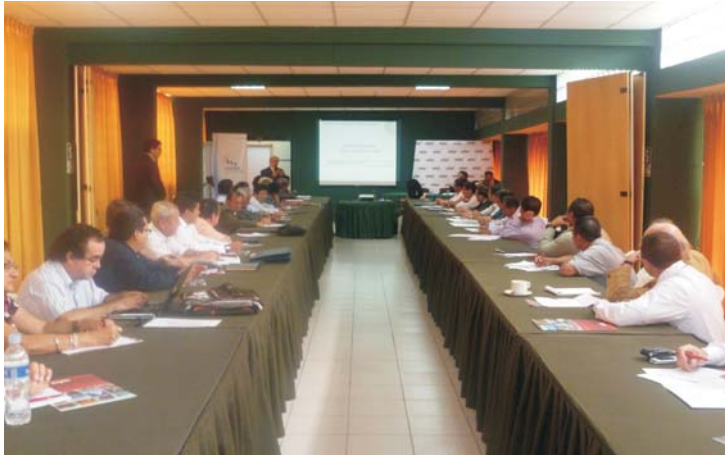
Autoridades de los cinco departamentos fronterizos participaron en foro sobre metas sociales binacionales.

El Centro Nacional de Planeamiento Estratégico del Perú CEPLAN, el Presidente de la Región Piura, autoridades de los cinco departamentos de la frontera y el Plan Binacional participaron en un foro realizado en Piura el 19 de octubre para informar a las autoridades locales de las provincias fronterizas sobre los avances en el proceso de formulación de las metas binacionales en materia de desarrollo con inclusión social, que vienen desarrollando el Centro de Planeamiento Estratégico del Perú (CEPLAN) y la Secretaría Nacional de Planificación y Desarrollo del Ecuador (SENPLADES), junto con el Plan Binacional, en cumplimiento de la instrucción contenida en la Declaración Presidencial Conjunta de Lambayeque.