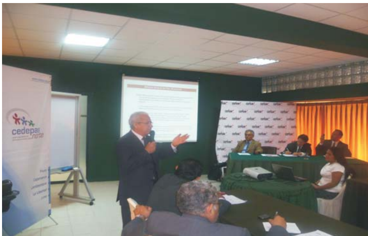
Director Ejecutivo del Capítulo Perú del Plan Binacional dirigiéndose a las autoridades presentes.

Asimismo, se conformaron paneles y grupos de trabajo con la activa participación de las autoridades presentes.