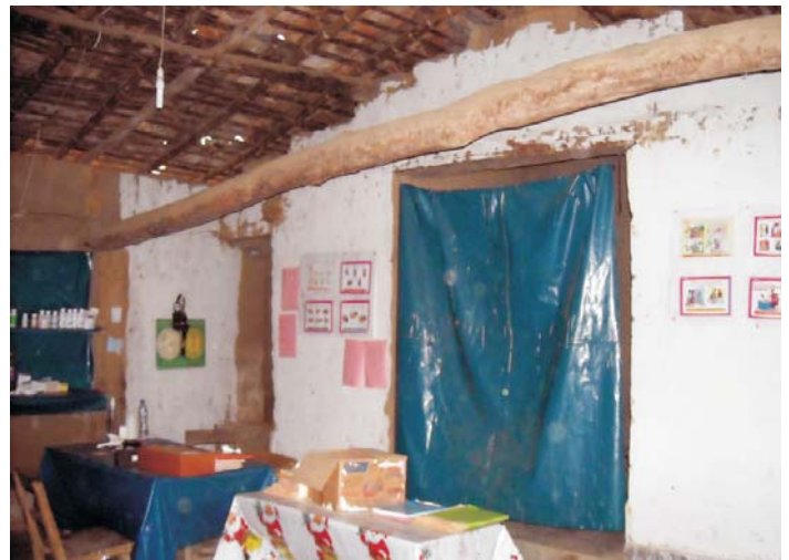
Esto cambiará. - Actual Centro de Salud de Sauce, en Sapillica, Ayabaca, con la firma del convenio pronto tendrá nuevos y mejores espacios para atender a su población.

El 25 de octubre se suscribió el convenio entre la Municipalidad Distrital de Buenos Aires, de la provincia de Morropón, en Piura, y el Plan Binacional, a fin de cofinanciar la construcción de dos aulas y SSHH, patio de formación, pozo séptico y pozo percolador y el equipamiento con mobiliario escolar del CEI N° 081- Carrasquillo, por un monto total de US$ 81 011,52, con un aporte del Fondo Binacional de US$ 60,000