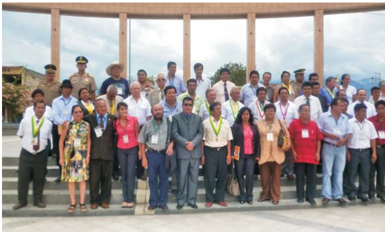
Alcaldes del sur del Ecuador y norte del Perú presentes en XXVI reunión de ABIMSENOP en Bagua Grande.

El Plan Binacional participó en la XXVI Asamblea de la Asociación Binacional de Municipalidades del Sur del Ecuador y Norte del Perú –ABIMSENOP, realizada del 3 al 5 de octubre del año en curso de en la ciudad de Bagua Grande, capital de la provincia amazónica de Utcubamba.