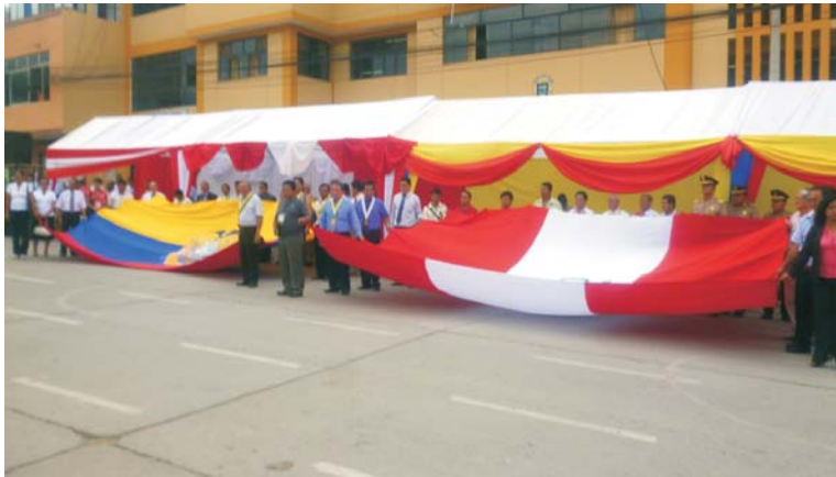
Autoridades peruanas y ecuatorianas en significativa ceremonia en la Plaza de Armas de Bagua Grande.