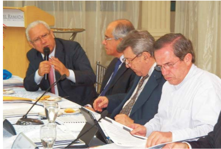
Los Capítulos Perú y Ecuador del Plan Binacional informaron sobre sus avances, logros y retos aportaron al debate de los temas.

Con ocasión de la XI Reunión de la Comisión de Vecindad Perú-Ecuador, realizada el 19 de septiembre en la ciudad de Guayaquil y que estuvo presidida por los Ministros de Relaciones Exteriores del Perú y Ecuador, Rafael Roncagliolo y Ricardo Patiño, respectivamente, el Plan Binacional informó sobre sus avances, logros y proyecciones.