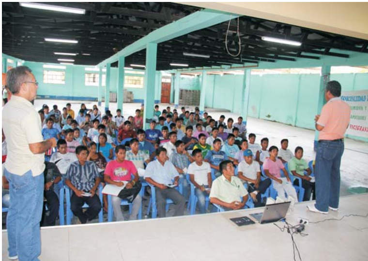
Generando capacidades locales para la sostenibilidad del proyecto. Conjunción de esfuerzos para este proyecto de particular interés para las comunidades locales de Imaza.

El Gobierno de la Región Amazonas, el Instituto de Investigación de la Amazonia Peruana (IIAP) y el Plan Binacional (en el marco del compromiso asumido en la lucha contra la desnutrición crónica infantil), vienen apoyando el proyecto de mejoramiento y fortalecimiento de capacidades productivas en piscigranjas en las localidades de Wayampiak, Túpac Amarú, Chiriaco y el Maraón, en el distrito de Imaza, que registra el mayor índice de pobreza (superior al 90%) a nivel de toda la Zona de Integración Fronteriza y en el que la desnutrición crónica que afecta al 76% de sus habitantes, mayoritariamente perteneciente a la etnia awajún, siendo sus principales víctimas los niños.