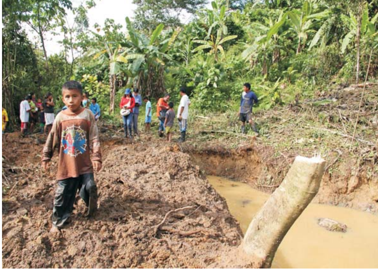
Piscigranjas para combatir la desnutrición crónica infantil en Imaza. El esfuerzo conjunto del Gobierno de la Región Amazonas, el Municipio de Imaza, el Instituto de Investigaciones Amazónicas del Perú, el Plan Binacional y la población local para enfrentar el 76% de desnutrición crónica en Imaza, distrito con 90% de pobreza.

"Regala un pescado a un hombre y le darás alimento para un día, enséñale a pescar y lo alimentarás para el resto de su vida."