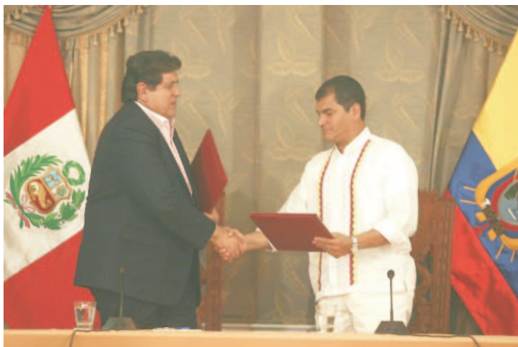
El buen rumbo de las relaciones entre Perú y Ecuador animó al Presidente del Perú, Alan García, referirse a una nueva nación "Ecuaperuana".

Durante la III Reunión Binacional de Gabinetes de Ministros Perú - Ecuador, llevada a cabo en la ciudad de Piura, Perú, el pasado 22 de octubre, los Presidentes del Perú y Ecuador, Alan García y Rafael Correa respectivamente, coincidieron en que las relaciones entre ambos países atraviesan por su mejor momento histórico.