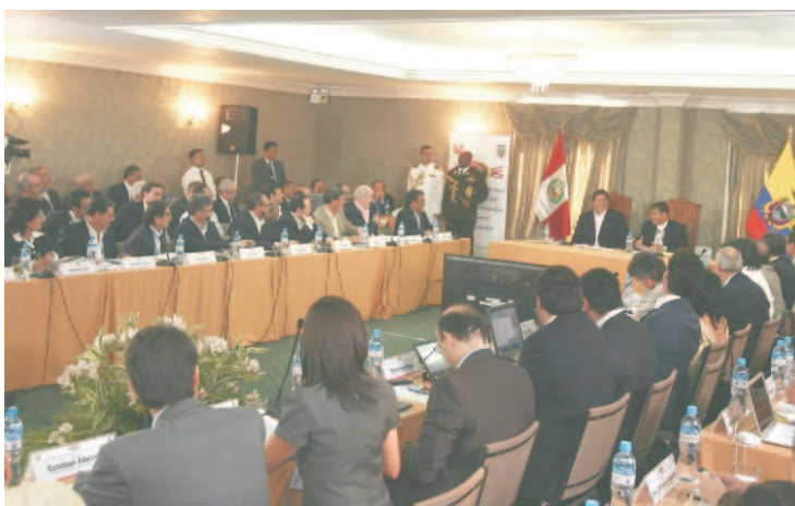
Los mandatarios se comprometieron a impulsar proyectos relacionados con la educación, salud, transportes y la cultura, entre otros, para fomentar el desarrollo de los pueblos fronterizos.

Los dos mandatarios subrayaron el rol que desempeña el Plan Binacional de Desarrollo de la Región Fronteriza y el Fondo Binacional para la Paz y el Desarrollo, como promotores y articuladores del desarrollo de la zona fronteriza común, cuyos proyectos en salud, educación, agua, saneamiento, electrificación, etc. mejoran el nivel de vida de la población de frontera y facilitan la integración. Concordaron en que los dos países están