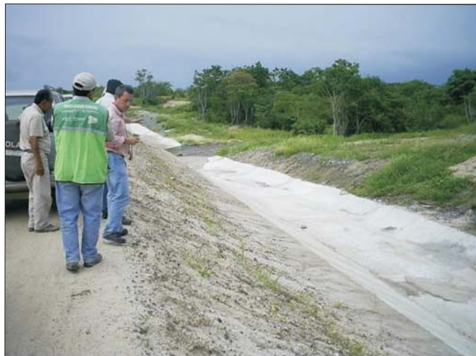
Por el momento las obras del Eje Vial N° 1 se han paralizado debido a las intensas lluvias; sin embargo las construcciones resistieron las inclemencias. Los trabajos se retomarán inmediatamente mejoren las condiciones climáticas.

Asimismo, el terraplén quedó intacto. La mezcla de material colocado en éste, permitió soportar las excesivas lluvias, confirmando su capacidad de resistencia de más del 20%.