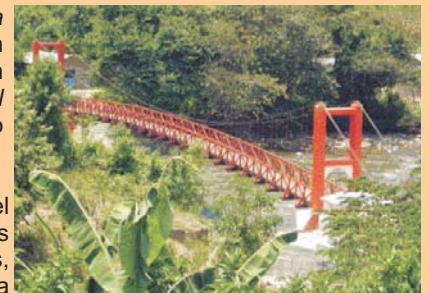
Puente Peatonal El Santuario

Esta iniciativa nació de la intención de apoyar a los 12,904 habitantes de los caseríos del distrito de Namballe que tenían que atravesar el caudaloso río Namballe para trasladar sus productos agrícolas y vacunos, así como acceder a servicios de educación y salud. Niños, jóvenes y adultos corrían serios peligros al cruzar a pie o a lomo de bestia este río para llegar a su destino, y el riesgo se incrementaba en la época de crecida por lluvias.