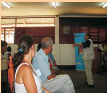
Taller de Concertación

Como parte del proyecto Promoción del Desarrollo Humano Sostenible en el Río Santiago , los días 21 y 22 de marzo se realizó, en las instalaciones de la Gerencia Sub Regional de Amazonas, el Taller de Desarrollo Local en Condorcanqui, distrito de Santa María de Nieva . El mencionado taller tuvo como finalidad iniciar un trabajo articulado por parte del Gobierno Regional de Amazonas y las Instituciones Cooperantes que intervienen en la provincia de Condorcanqui para optimizar recursos y esfuerzos, identificando las sinergias institucionales.