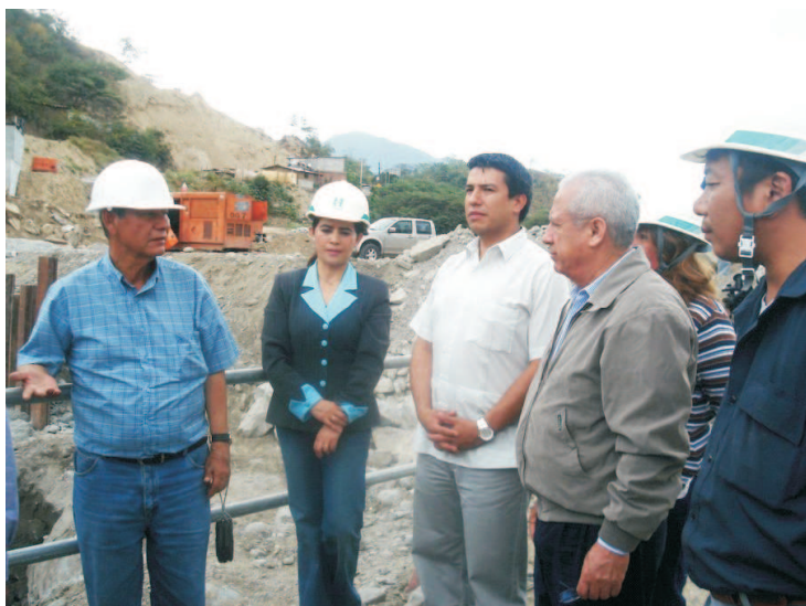
Reunión de evaluación. Comité de Coordinación Binacional del Proyecto.