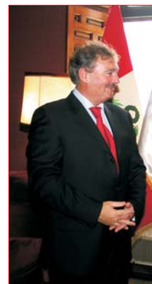
Sr. Jean Asselborn Viceprimer Ministro y Ministro de Asuntos Exteriores y de la Inmigración del Gran Ducado de Luxemburgo

Actualmente se ejecuta el Proyecto Integral Binacional Fronterizo Perú Ecuador es financiado por el Gobierno del Gran Ducado de Luxemburgo, por un monto total de US $ 5,0 millones para ambos países. El componente peruano del proyecto demanda una inversión total del orden de los US$3,8 millones, de los cuales el aporte de la cooperación del Gran Ducado de Luxemburgo es de U$ 2,5 millones. El proyecto apoya intervenciones en agua y saneamiento electrificación en localidades rurales de la zona fronteriza; su ejecución beneficiará a 40,000 pobladores de 56 localidades carentes de los citados servicios.