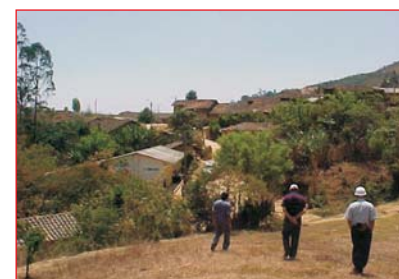
Localidad de Espíndola que será electrificada