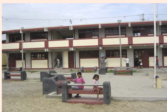
Nuevo pabellón del C.N. N° 011 – César Vallejo