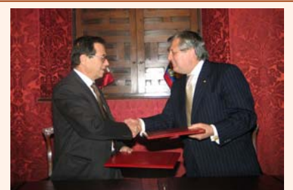
IX Reunión de Mecanismo de Consultas Diplomáticas

Los Vicecancilleres reiteraron su apoyo a las gestiones que realizan los Directores Ejecutivos del Plan Binacional y el Secretario Ejecutivo del Fondo Binacional para conseguir nuevas fuentes de financiamiento; y acordaron gestionar ante las autoridades nacionales respectivas la oportuna provisión de los aportes que corresponden al Plan y al Fondo Binacional para continuar con la ejecución de los Ejes Viales Binacionales, la reconstrucción y limpieza del Canal Internacional de Zarumilla y el estudio de factibilidad del Proyecto Puyango - Tumbes.