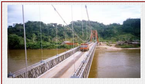
Puente sobre río Nieva