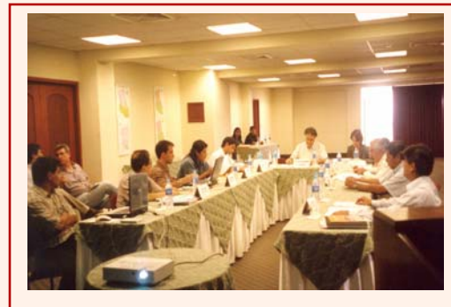
Reunión del Comité Interinstitucional de seguimiento del proyecto Morona - Pastaza

Cabe destacar que el proyecto está orientado a ejecutar acciones de desarrollo en beneficio de la población de las comunidades indígenas, de las cuencas de los ríos Pastaza y Morona, basadas en el uso y conservación de los recursos naturales, y cuenta con el apoyo del Gobierno de Alemania, mediante un canje de Deuda, por un monto de 7'554,437 millones de Euros.