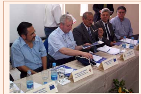
Presentación de estudios del Eje Vial N°1

Las Cancillerías del Perú y Ecuador suscribirán el Convenio de Financiamiento con la Unión Europea que formaliza una contribución de 51 millones de Euros (unos 63 millones de dólares) para financiar el proyecto del Eje Vial N°1 Piura – Guayaquil. La ejecución del proyecto estará a cargo de los Ministerios de Transportes del Perú y Obras Públicas del Ecuador.